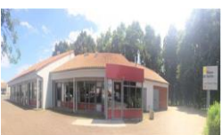
Saint-André d' Ornay