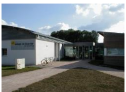
Val d' Ornay